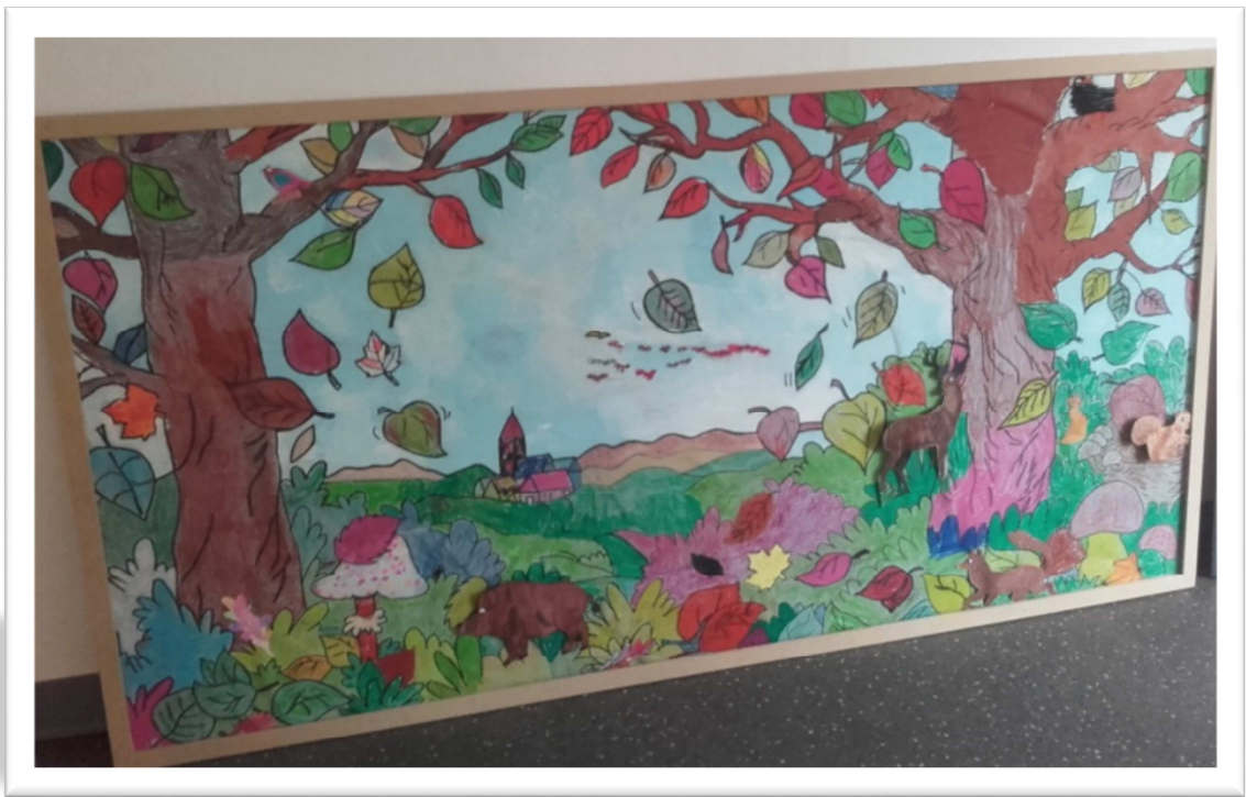
Les fresques qui ont été réalisées par les résidents et les enfants au cours de l'année